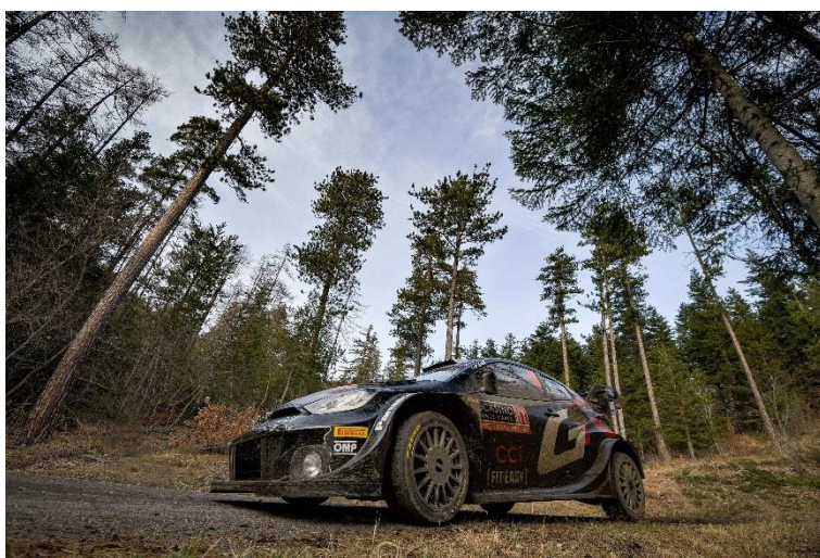
La GR Yaris Rally1 HYBRID 2024

Depuis son retour dans le Championnat du Monde FIA des Rallyes en 2021, le Safari a renoué avec sa réputation d'être l'une des épreuves les plus difficiles du sport automobile. C'est un défi que TOYOTA GAZOO Racing a déjà relevé avec succès avec trois victoires consécutives ces trois dernières années, portant ainsi à 11 le nombre record de victoires de Toyota sur ce rallye. En 2022 et 2023, TOYOTA GAZOO Racing a marqué l'histoire de l'épreuve africaine en terminant aux quatre premières places.