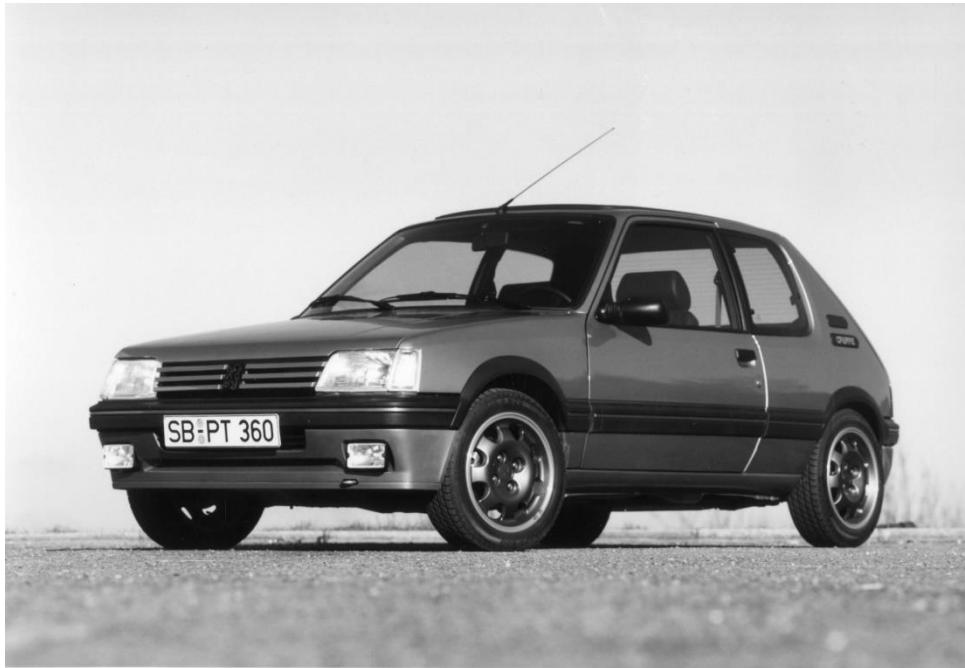
PEUGEOT 205 GRIFFE

En 2023, la PEUGEOT 205 fête son 40e anniversaire !