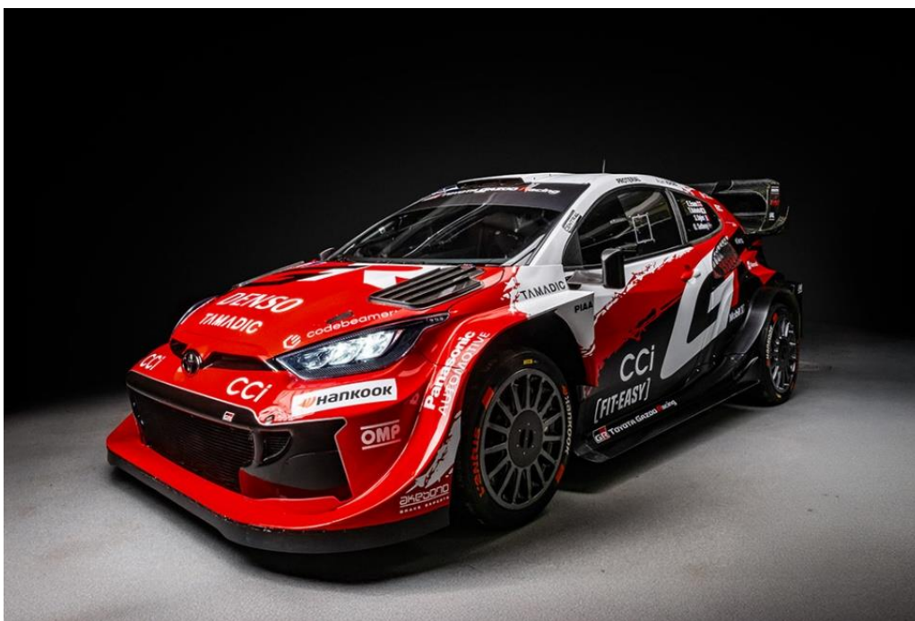
La GR YARIS Rally1 2026