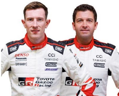
Elfyn Evans/Scott Martin

« Après une courte pause, j'ai hâte de commencer la nouvelle saison et, je l'espère, de me battre aux avant-postes. Je suis certain que ce sera une saison disputée et nous devons être au top de notre forme. Il y a une certaine continuité au niveau de la voiture et des pneus, et même si nous avons terminé la saison dernière à un bon classement, l'équipe travaille sans cesse à améliorer les performances, ce petit plus que nous, les pilotes, réclamons constamment. Le Rallye de Monte-Carlo comprend toujours une part d'inconnue, car on ne peut jamais prévoir les conditions auxquelles on sera confronté. C'est un défi immense et il faut savoir s'adapter au mieux pendant l'épreuve. »