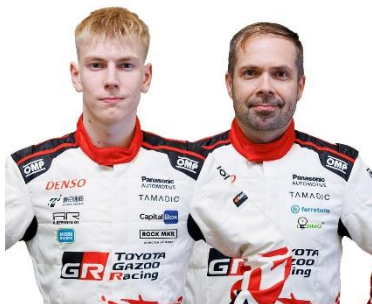
Sami Pajari / Marko Salminen

« C'est un sentiment exaltant de commencer ma deuxième saison avec la Rally1. L'année dernière fut principalement consacrée à l'apprentissage, car c'était la première fois que je participais à la plupart des rallyes avec cette voiture. Cependant, au cours de la seconde moitié de saison, les choses se sont nettement améliorées et je me sens désormais beaucoup plus prêt à être compétitif. La voiture est quasiment identique à celle de l'année dernière, tout comme les pneus, et je comprends beaucoup mieux son potentiel. Le Rallye de