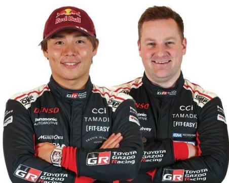
Takamoto Katsuta / Aaron Johnston

« Le Rallye du Japon est très spécial pour moi puisque c'est ma course à domicile, et j'ai donc vraiment hâte de piloter ici de nouveau devant ma famille et mes amis. Ce sera la quatrième fois que nous courons l'épreuve du WRC au Japon. Après avoir terminé sur le podium en 2022, je voudrais essayer d'y remonter cette année. Ce n'est jamais un rallye facile avec les routes de montagne étroites, les conditions d'adhérence changeantes et le risque d'une météo compliquée. Je suis relativement confiant après nos chronos et notre bon résultat en Europe Centrale, et je donnerai tout pour décrocher mon meilleur résultat ici, pour moi, pour l'équipe et pour les fans de rallye japonais. »