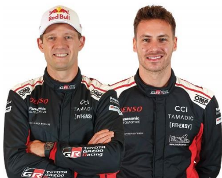
Sébastien Ogier/Vincent Landais

« Le Rallye du Japon est toujours un événement spécial dans le calendrier pour nous, et il sera d'autant plus intéressant à suivre cette année compte tenu des écarts infimes au championnat des pilotes à seulement deux courses de la fin de la saison. Les spéciales sont très exigeantes sur ce rallye : elles sont étroites, techniques, et n'offrent que peu de marge d'erreur. Nous avons aussi déjà pu constater que la météo pouvait encore compliquer les choses à cette époque de l'année. Le rallye précédent ne nous a pas vraiment été favorable, mais nous savons que la vitesse est là et que nous avons encore la possibilité de nous battre. Nous ferons de