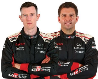
Elfyn Evans/Scott Martin

« Être de retour sur le podium nous a fait du bien lors des deux rallyes sud-américains au terme d'une longue série de rallyes sur terre. Désormais, nous avons hâte de retrouver l'asphalte et de faire face à un nouveau défi lors de ces prochaines épreuves. Il y a une part d'inconnu liée à des conditions qui pourraient se révéler très différentes de celles que nous avons rencontrées lors du dernier rallye sur asphalte aux Canaries. Le Rallye d'Europe centrale englobe une zone assez vaste sur laquelle il y a des changements de revêtement et de paysage, l'adhérence peut donc varier considérablement. Il y a des sections rapides sur des routes dégagées et d'autres plus techniques sous les arbres. Il peut aussi y avoir des passages boueux, surtout s'il pleut à l'approche du rallye, mais nous verrons bien à quoi ressembleront les spéciales cette année et nous ferons de notre mieux. »