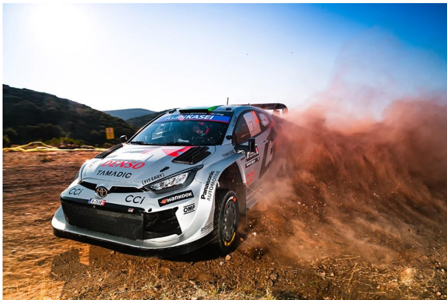
La GR Yaris Rally1 2025