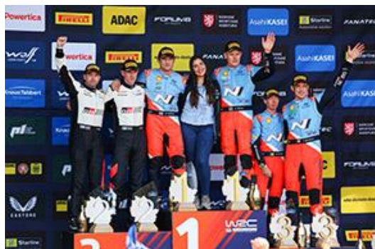
Cérémonie du podium