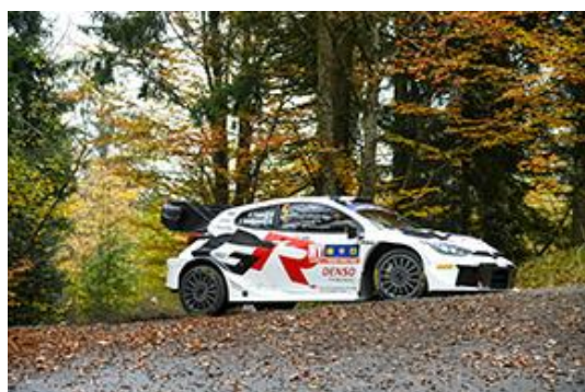
Voiture 5 (Sami Pajari, Enni Mälkönen)

TOUTES LES INFORMATIONS SONT DISPONIBLES SUR