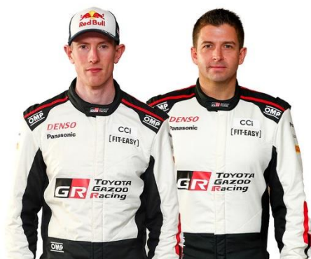
Elfyn Evans/Scott Martin

« Après la belle performance de l'équipe au Chili, nous avons été heureux de remonter sur le podium. Maintenant nous voulons tirer le meilleur parti de ces deux manches sur asphalté qui terminent la saison. Nous savons que les rallyes d'Europe centrale et du Japon peuvent être assez difficiles en termes de météo et de telles épreuves représentent un défi pour un pilote, surtout avec la dimension supplémentaire de travailler avec nos équipes d'ouvriers. Notre temps de pilotage sur cette surface est assez limité au cours de l'année, mais au moins les conditions que nous attendons ne sont pas si différentes