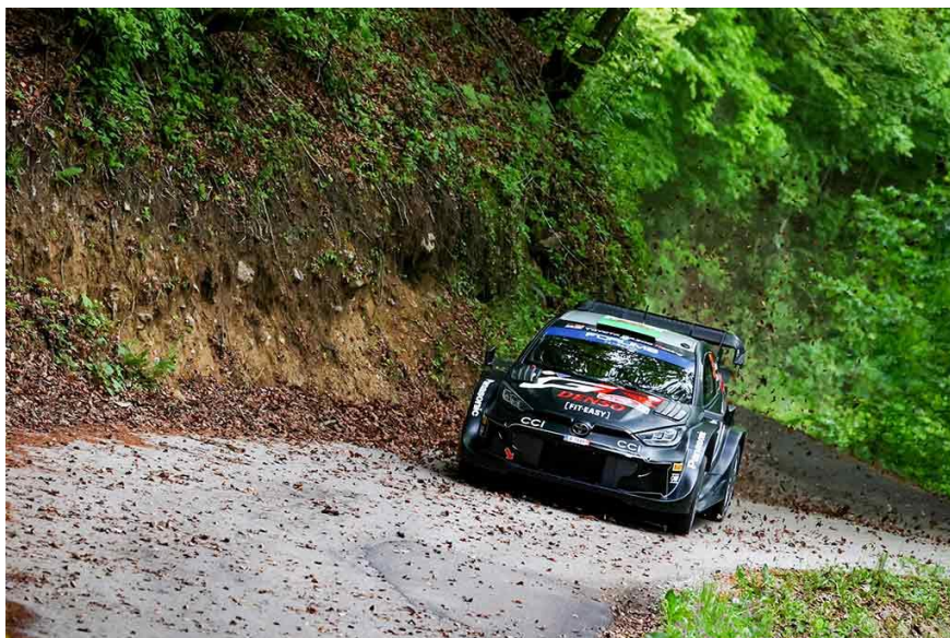
La GR Yaris Rally1 HYBRID 2024

Après avoir fait le plein de point lors de la manche précédente au Chili, l'équipe TOYOTA GAZOO Racing a réduit de plus de moitié l'écart avec la tête du championnat des constructeurs, celui-ci passant de 35 à 17 points à deux manches de la fin de la saison.