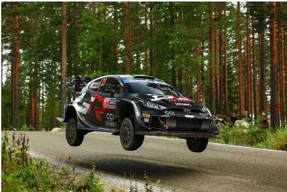
La GR Yaris Rally1 HYBRID 2024

Après un Rallye de l'Acropole où ses performances n'ont pas été récompensées, l'équipe TOYOTA GAZOO Racing est particulièrement motivée. Elle arrive au Chili avec un solide trio de pilotes afin de lutter pour la victoire, avec Kalle Rovanperä, Elfyn Evans et Sébastien Ogier, tous engagés pour marquer des points au