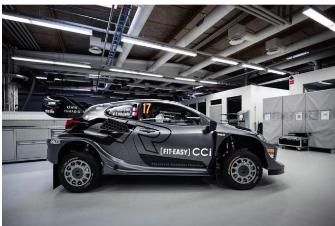
La GR Yaris Rally1 HYBRID dans sa livrée spéciale pour Sébastien Ogier