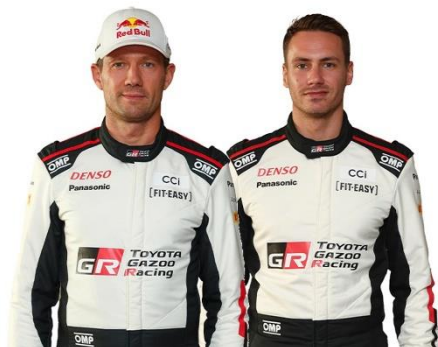
Sébastien Ogier/Vincent Landais

« Le Rallye de Finlande est une épreuve unique du championnat, et je pense que tous les pilotes aiment le disputer. C'est aussi un rallye difficile, où les pilotes locaux ont toujours été très forts, mais c'est le genre de défi que j'aime et c'est un rallye que j'avais vraiment envie de refaire après quelques années d'absence. C'est aussi une épreuve à domicile pour l'équipe, bien sûr, et je suis heureux de faire partie de cette équipe solide. Je vais essayer de faire tout ce que je peux pour obtenir le meilleur résultat pour l'équipe. Après avoir fait une pause dans les rallyes très rapides, je pense que j'ai