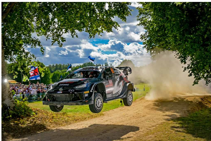
La GR Yaris Rally1 HYBRID 2024

Les spéciales du centre de la Finlande sont les plus rapides et les plus spectaculaires du WRC. Elles sont également le terrain d'entraînement de l'équipe TOYOTA GAZOO Racing de rallye, dont le siège se trouve non loin du parc d'assistance de Jyväskylä et qui a obtenu cinq victoires lors des six dernières éditions de l'épreuve.