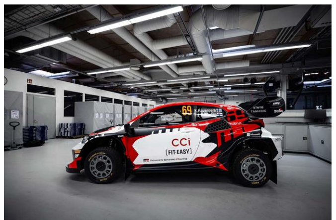
La GR Yaris Rally1 HYBRID dans sa livrée spéciale pour Kalle Rovanperä