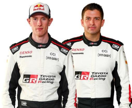
Elfyn Evans/Scott Martin

« Le Rallye de Finlande est toujours un moment important du calendrier pour moi, et ce sera une semaine importante pour l'équipe et pour le championnat. Nous avons été forts là-bas par le passé et devrions avoir une bonne base de travail. Et avec les essais que nous avons fait la semaine dernière, nous devrions être dans une assez bonne position pour débiter le rallye. L'effet du nettoyage de la route n'est normalement pas aussi important qu'en Lettonie, donc il est généralement possible de se battre aux avant-postes, mais nous devons attendre de voir comment seront les conditions météo dans les jours précédant vendredi. J'attends cela avec impatience comme toujours : les routes sont incroyables