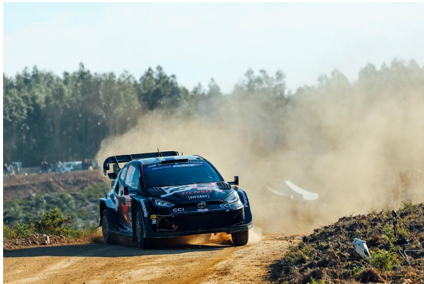
La GR Yaris Rally1 HYBRID 2024

Le retour du WRC en Pologne pour la première fois depuis 2017 marque la mi-saison 2024 et sera suivi d'une épreuve inédite en Lettonie en juillet avant le classique Rallye de Finlande – la course à domicile de TOYOTA GAZOO Racing – début août. Bien que les trois épreuves soient constituées de spéciales sur terre rapides et fluides, chacune proposera également ses propres défis.