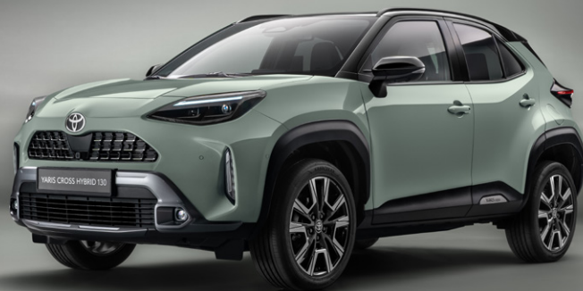
YARIS CROSS PREMIERE