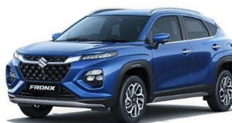
L'actuel Suzuki Fronx

Suzuki a commencé à produire des voitures en Inde en décembre 1983 avec la Maruti 800. Fin mars 2024, l'Inde est devenu le deuxième pays après le Japon dans lequel Suzuki a franchi le cap des 30 millions de voitures produites, et le pays le plus rapide à le faire en seulement 40 ans et 4 mois (contre 55 ans et 2 mois au Japon).