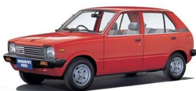
Le premier modèle, la Maruti 800

Fin mars 2024, Suzuki a passé le cap des 30 millions de voitures produites en Inde depuis ses débuts en 1983. Leader d'un marché indien en développement rapide, Suzuki prévoit d'augmenter de plus de 75 % sa capacité de production dans le pays d'ici l'exercice 2030.