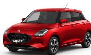
Burning Red Pearl Metallic