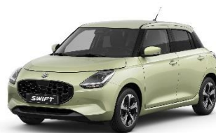
Cool Yellow Metallic