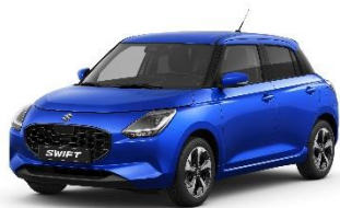
Frontier Blue Pearl Metallic

SUZUKI FRANCE S.A.S 8, avenue des Frères Lumière 78190 TRAPPES – France