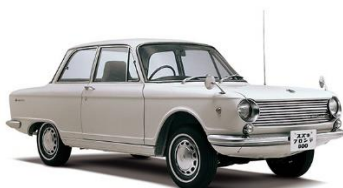
1965 Fronte 800