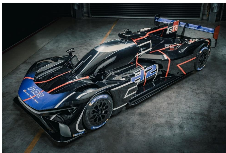
Le GR H2 Racing Concept

Dans une conférence de presse qui s'est déroulée aujourd'hui au Mans, Akio Toyoda a présenté en première mondiale le « GR H2 Racing Concept, un prototype de voiture de course à hydrogène