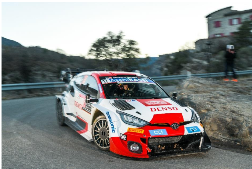
La GR YARIS Rally1 HYBRID 2023

L'équipe TOYOTA GAZOO Racing arrive en Croatie le cœur lourd après le décès, la semaine dernière, de Craig Breen. TOYOTA GAZOO Racing présente ses plus sincères condoléances à sa famille et à son équipe, Hyundai Motorsport.